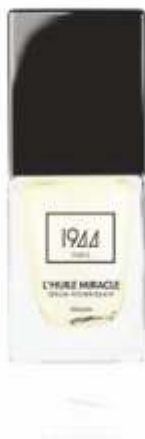
L'HUILE MIRACLE AVEC PINCEAU VT003