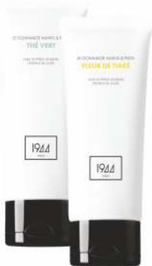
THÉ VERT CRO04