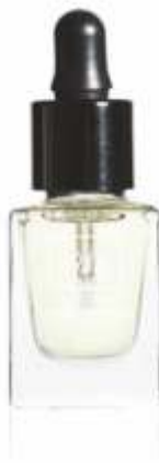
L'HUILE MIRACLE AVEC PIPETTE VT005

Pečující olejíček příjemně vonící po kokosu vyživuje, vyhlazuje a posiluje nehty, přičemž hloubkově hydratuje nehtovou kůžičku.