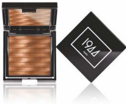
EPO01 CLAM & MOÏEN MOÏEN & FONCÉ EPO02 MOÏEN & FONCÉ