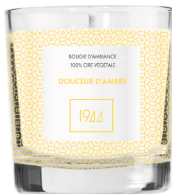
PARFÉM SLADKÝ JANTAR G1102