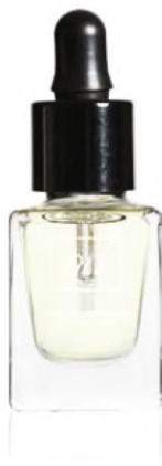
L'HUILE MIRACLE AVEC PIPETTE VT005

Pečující olejíček příjemně voní po kokosu vyživuje, vyhlazuje a posiluje nehty, přičemž hloubkově hydratuje nehtovou kůžičku.