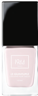
LE QUINTUPLE MALVINA VT104