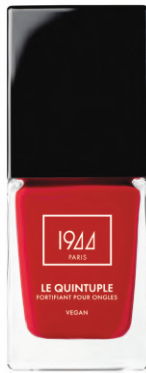
LE QUINTUPLE KARINE VT103