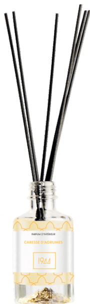
PARFÉM CITRUSOVÉ POHLAZENÍ G1001