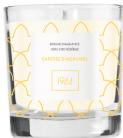
PARFÉM CITRUSOVÉ POHLAZENÍ G1002