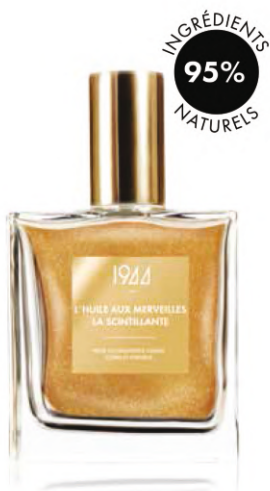
LA SCINTILLANTE HL001