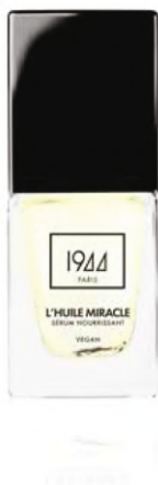
L'HUILE MIRACLE AVEC PINCEAU VT003