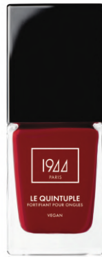
LE QUINTUPLE FLORENCE VT102

Le Quintuple je veganská péče o nehty, která posiluje křehké nehty, zabráňuje třepení a stimuluje keratin, nehty zanechává krásnější, lesklejší a chráněné před vnějšími vlivy.