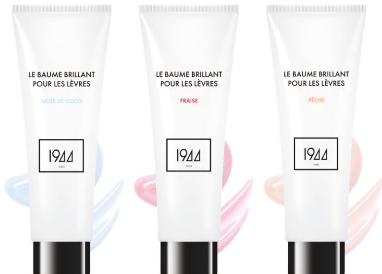
KOKOS RA 601