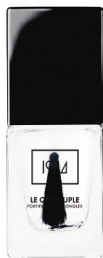
LE QUINTUPLE TRANSPARENT VT101

VEGANSKÁ POSILUJÍCÍ PÉČE O NEHTY 5 VITAMÍNŮ - 5 ROSTLINNÝCH EXTRAKTŮ