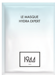
HYDRATAČNÍ EXPERT MH102