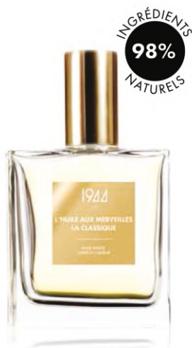
LA CLASSIQUE HL002